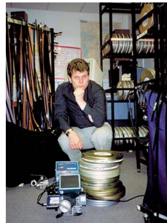
Režisors un operators. 1972. gadā sācis strādāt Rīgas kinostudijā par operatora asistentu, tad bijis operators un no 1979. gada režisors