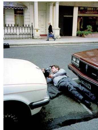
Lielbritānijā filmējot dokumentālo filmu par PSRS sabrukumu “Mēs?”. Filma saņēma Latvijas kinematogrāfijai nebijušu atzinību — 1990. gada galveno televīzijas balvu Eiropā — Prix Italia , bet 1991. gadā arī Britu karaliskās televīzijas biedrības balvu