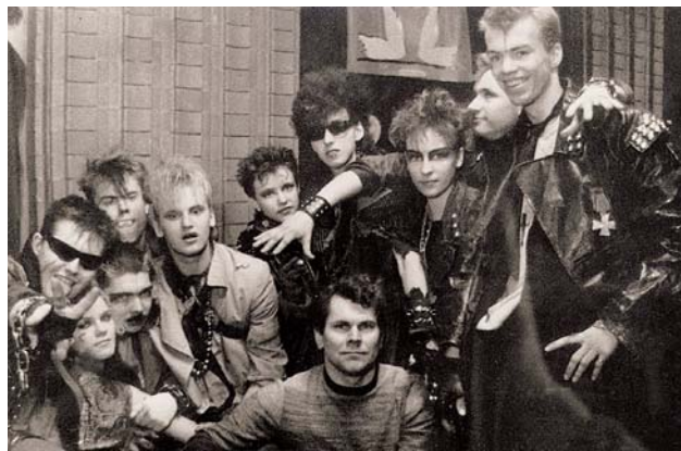
Dokumentālās filmas “Vai viegli būt jaunam?” režisors un varoņi. Filmu “Vai viegli būt jaunam?” tikai bijušās PSRS kinoteātros vien gada laikā noskatījās 28 miljoni skatītāju, tā demonstrēta vairāk nekā 80 valstīs