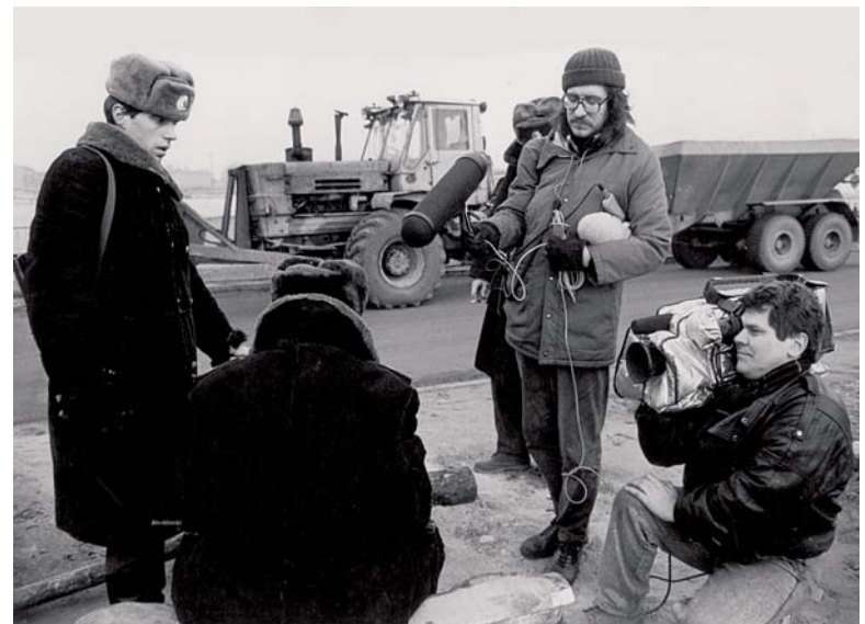
1991. gada janvāris, barikādes Rīgas ielās. 1991. gada janvārī, aizstāvojot savu brīvību, tauta Rīgas ielās veidoja barikādes. Notiekošo filmēja Jura Podnieka filmēšanas grupa

Latviešu tautas manifestāciju dokumentējot. 1990. gada 4. maijā pēc “Deklarācijas par Latvijas neatkarības atjaunošanu” pieņemšanas latviešu tauta pulcējās Daugavmalā un pauda savu atbalstu Augstākās padomes deputātiem