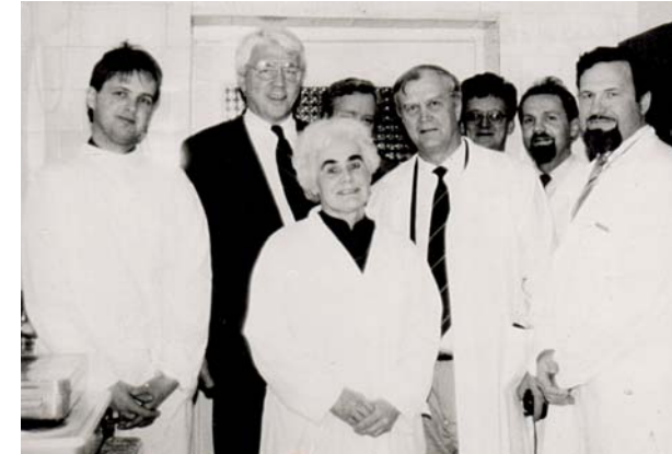
Aktīvs Tautas frontes atbalstītājs. 1990. gadā Alūksnē kopā ar Alūksnes slimnīcas ārstu kolektīvu un profesoru Viktoru Kalnbērzu, aģitējot par Latvijas Tautas frontes idejām