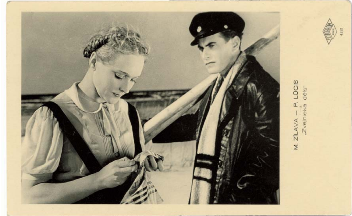
"Zvejnieka dēls". Pētera Lūča un Mildas Zilavas fotoattēli pastkartēs vai citā veidā tika tirāzēti simtos tūkstošos eksemplāru