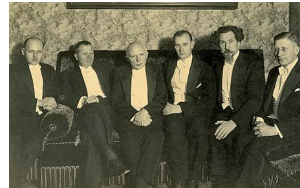
Baltijas medicīnas dzīves apvienotājs un organizators. Pauls Stradiņš kopā ar Latvijas, Lietuvas un Igaunijas ārstiem 1938. gadā. Pirmais no kreisās Pauls Stradiņš, trešais — Jēkabs Alksnis, sestais — Aleksandrs Bieziņš