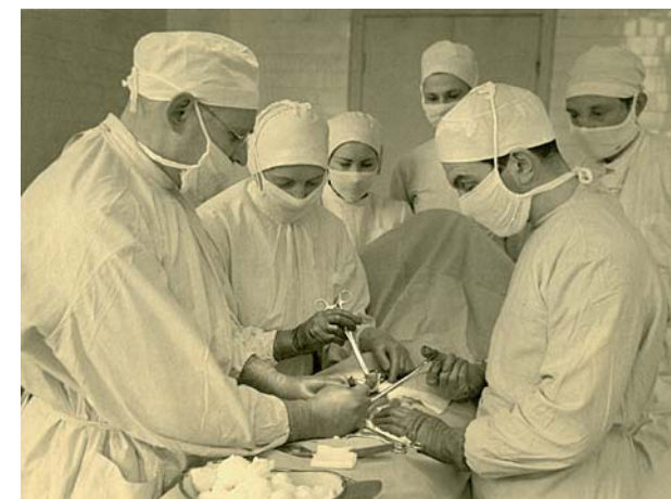
Izcils ķirurgs un docētājs. Pauls Stradiņš operē. Kopā ar viņu operējot, ķirurģijas pamatus apguvuši vai specialitātē papildinājušies gandrīz visi 20. gadsimta 40. un 50. gadu Latvijas ķirurgi