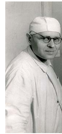
Rīgas pilsētas 2. slimnīcā (tagad Paula Stradiņa Universitātes klīniskā slimnīca). Galvenais ārsts, klīnikas vadītājs un ķirurgs Pauls Stradiņš. 50. gadu vidus

Miris 1958. gada 14. augustā Rīgā, apbedīts Meža kapos. 1958. gadā Republikas klīniskajai slimnīcai un Medicīnas vēstures muzejam tika piešķirts Paula Stradiņa vārds.