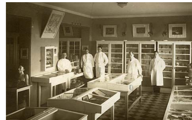
Medicīnas vēsturnieks, Medicīnas vēstures muzeja izveidotājs. Nežēlojot enerģiju, laiku un personiskos līdzekļus, Pauls Stradiņš savāca unikālu kolekciju. P. Stradiņa Medicīnas vēstures muzeja pirmsākumi Rīgas pilsētas 2. slimnīcas foajē datējami jau ar 1930. gadu