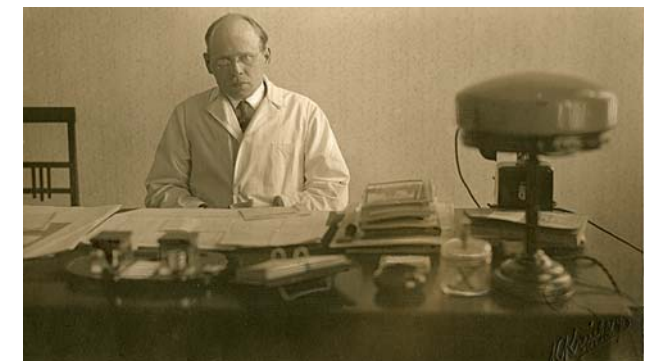
Izcils medicīnas organizators pie sava rakstāmgalda Rīgas pilsētas 2. slimnīcā. Otrajam pasaules karam beidzoties, daudzi latviešu ārsti devās bēgļu gaitās. Paulam Stradiņam nācās ne tikai vadīt Fakultātes ķirurģijas katedru un Medicīnas fakultāti Latvijas Universitātē, bet arī vadīt slimnīcu un ļoti daudz operēt

"Vajadzīgs liels ideālisms, lai būtu par ārstu. Un tieši tādēļ ārsta arods jau kopš gadu simtiem, kopš Homēra un Hipokrata, stāvējis augstu, ārsti uzlūkti kā likteņa svaidīti cilvēki. Medicīna no cilvēka daudz prasa, bet arī daudz dod." (P. Stradiņš)