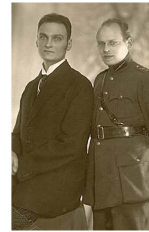
Studiju biedri — ķirurgi. Pauls Stradiņš kopā ar vēlāko padomju armijas galveno ķirurgu Nikolaju Jelanski, tam 1926. gadā caurbraucot viesojoties Rīgā. P. Stradiņš tērpiet Latvijas armijas uniformā