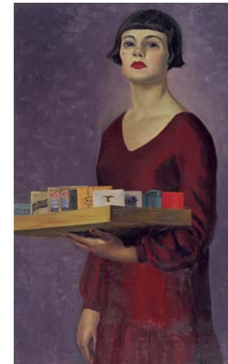
Kārlis Miesnieks. "Kafejnīcas meitene". 1923. gads. Audeklis, eļļa, 109x67. Latvijas Nacionālā mākslas muzeja īpašums. No K. Miesnieka sieviešu portretiem izstāro zināma lietišķība, tomēr tie ir istas sievietības aparoti. K. Miesnieks saviem modeļiem pievērsies ar dzīvu interesi un gleznojis tos reālistiski, iedziļinoties viņu psihē, rādījis viņus kā apgarotas, viengabalainas personības